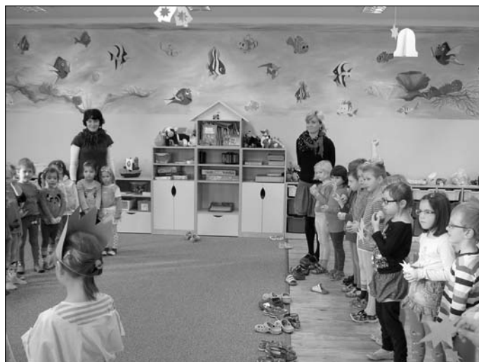
Děti v nové školce