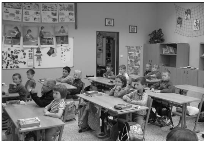
Žáci v nové učebně